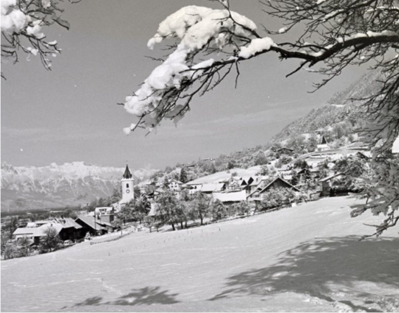
Dorfansicht von 1979